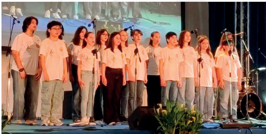
Coro Pascoli - Aprilia