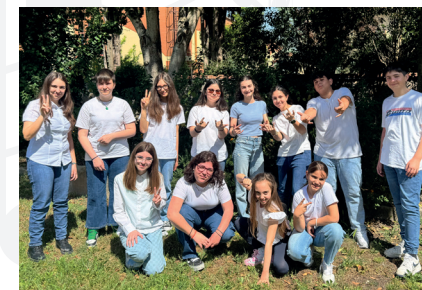
Coro "Note a Colori" - Pontinia