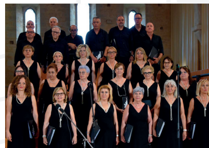
Corale Città di Pontinia