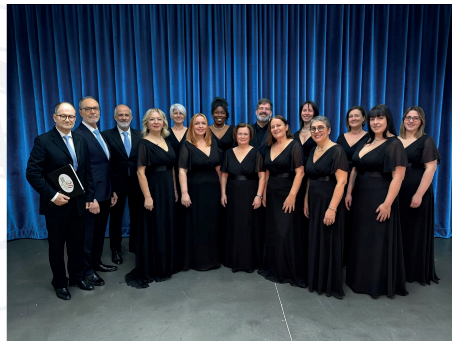
Coro Laeta Corda - Aprilia