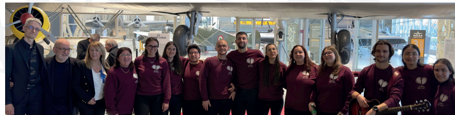
Coro "Teen...Canto" - Pontinia

e contemporaneo. È promotrice di eventi benefici nel suo territorio e scambi culturali in ambito nazionale ed estero. La valorizzazione di ogni aspetto culturale è il tema portante delle manifestazioni che la vedono protagonista. La Corale si è esibita oltre che in tutta la Provincia di Latina, nelle città di Roma, Assisi, Umbertide (PG), Segni (RM), al Salerno Festival e nel 2017 nella città di Praga e di Utena nel 2018.