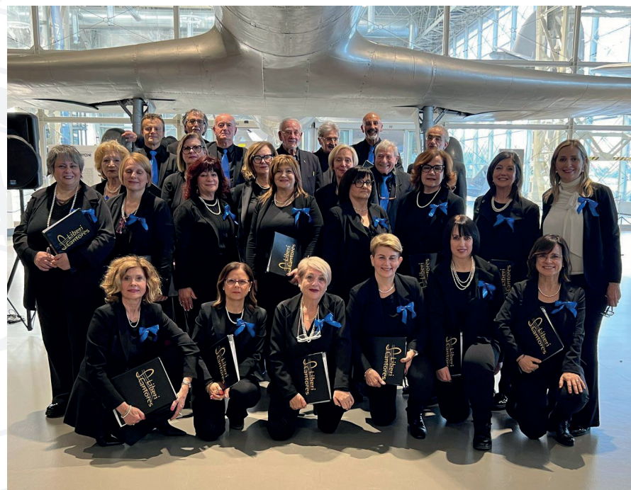
Coro Liberi Cantores - Aprilia