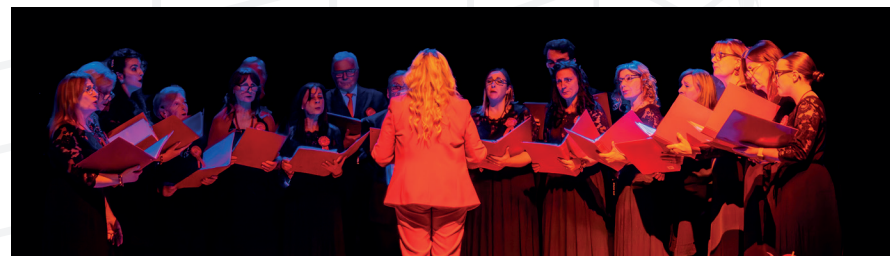
Coro San Pietro in Formis